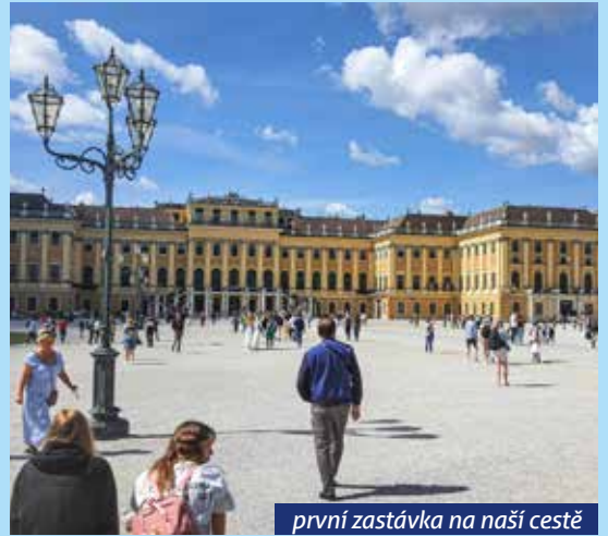
první zastávka na naší cestě