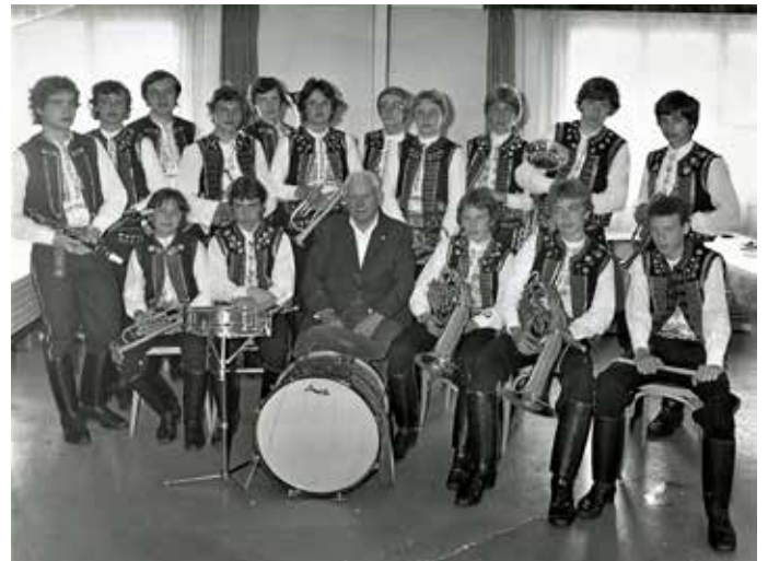
Kraj beze stínů Krumvíř 1980