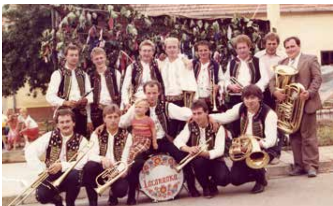
Lácaranka Nikolčice 1988