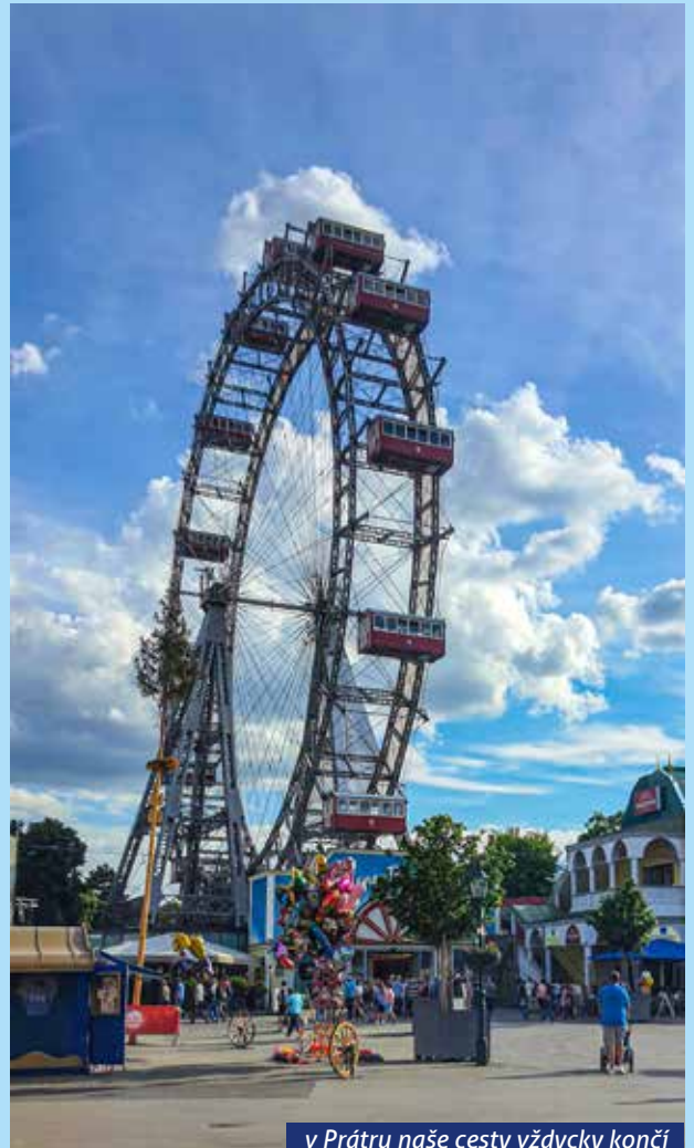
v Prátru naše cesty vždycky končí

KOBYLÍ DĚDINA - periodický tisk územního samosprávného celku vydává Obec Kobylí, adresa: Obecní úřad, Kobylí 459, 691 10 Kobylí IČO: 283266, tel.: 519 431 106, e-mail: podatelna@kobyli.cz Příprava – Táňa Rosochová, Jarmila Borovičková, Miroslava Řeháková vychází nepravidelně, místo vydání Kobylí, registrační číslo 370011091 grafická úprava a tisk: Stillus s.r.o. reklamní agentura Břeclav vyšlo v červnu 2024, náklad 600 výtisků, cena 12,- Kč, neprošlo jazykovou úpravou