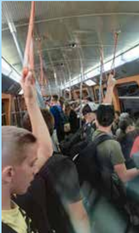
metrem prohlídka začíná