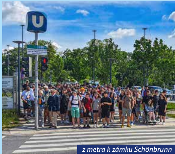
z metra k zámku Schönbrunn