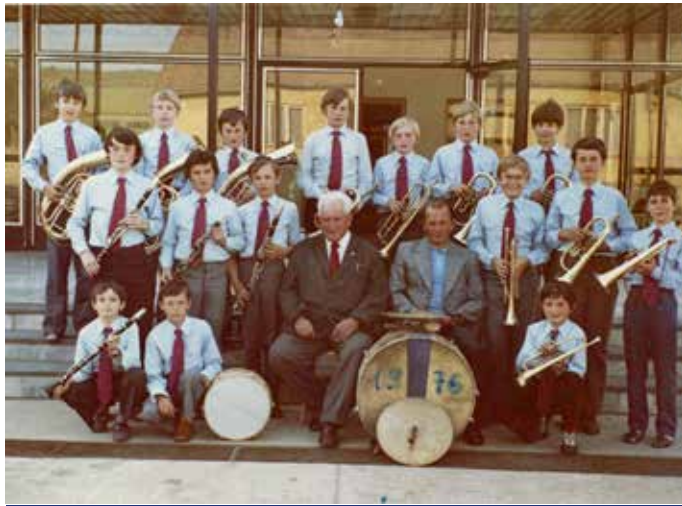
Lácaranka v r. 1976