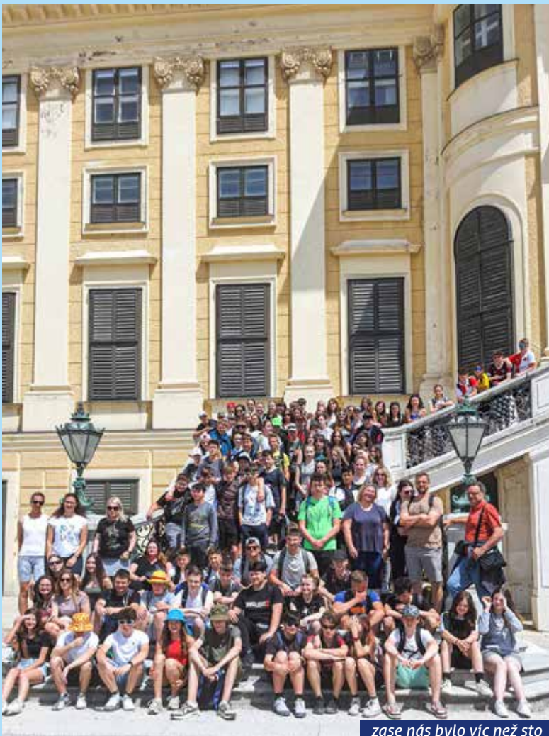
zase nás bylo víc než sto