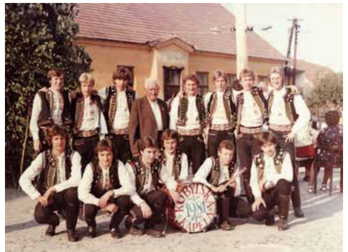
Lácaranka hody Boleradice 1981