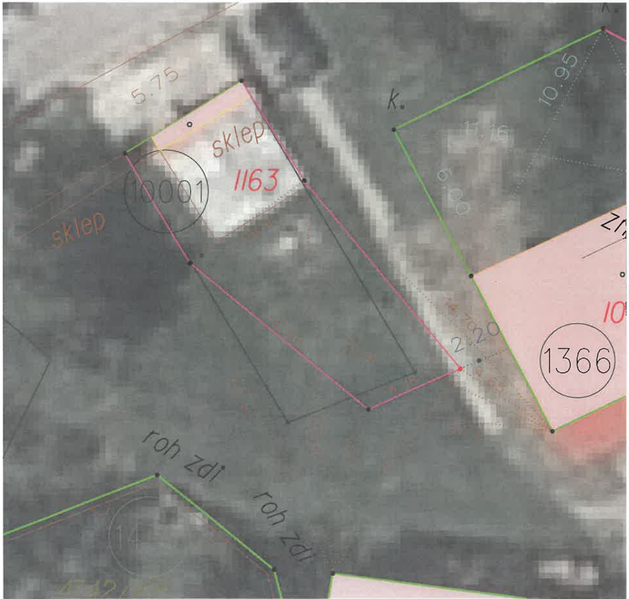
PRÍLOHA č. 3